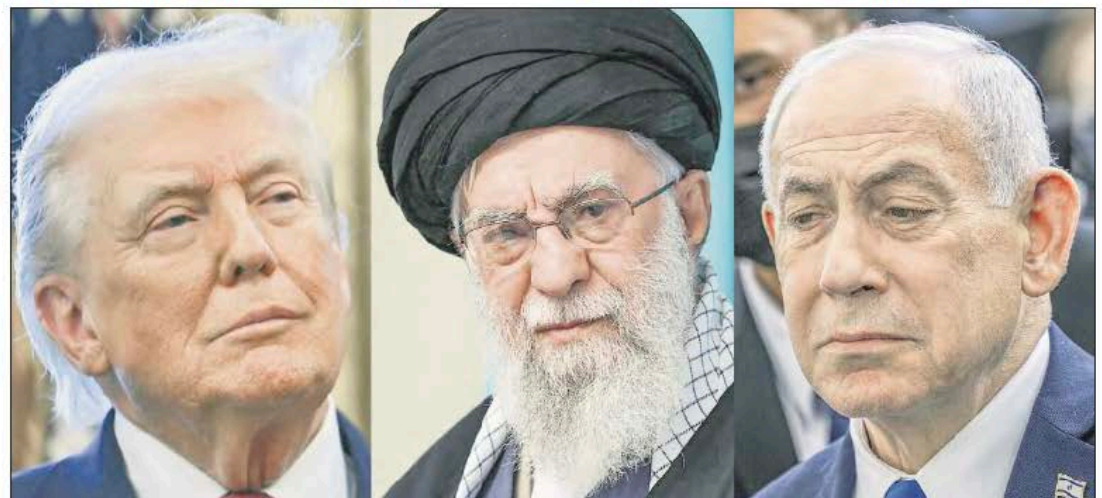
▼ Trump y Netanyahu celebraron el deceso del ayatollah -al centro-.

Trump declaró a CBS News que considera que tras la muerte de Jamenei, Estados Unidos está mejor posicionado para alcanzar una solución diplomática con Irán. "Es mucho más fácil ahora que hace un día, obviamente porque están recibiendo una paliza brutal".