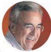
Rubén Rocha Moya

●● Nos cuentan que el bloque de gobernadores de Morena dejó de serlo, al menos en lo que se refiere al apoyo que se intentó armar para el mandatario estatal de Sinaloa, Rubén Rocha Moya , tras la acusación de EU en su contra por narcotráfico. En situaciones anteriores de crisis de alguno de ellos, el desplegado firmado por todos, incluso de los surgidos de partidos aliados como el PVEM, se distribuía sin demora para ver el cierre de filas. Esta vez, nos aseguran, fueron varios los que se negaron a poner su firma pese a la petición proveniente de la dirigencia del partido. Nos comentan que la grieta en el bloque causó molestia y el esfuerzo por darle un espaldarazo a don Rubén ahora se cocina para que surja del Consejo Nacional del próximo domingo y que así la ausencia de firmas de algunos góbers se diluya, pero hay quien desde las propias filas guindas advierte que ahora podrían sumarse negativas de consejeros y legisladores. El miedo no anda en visa.