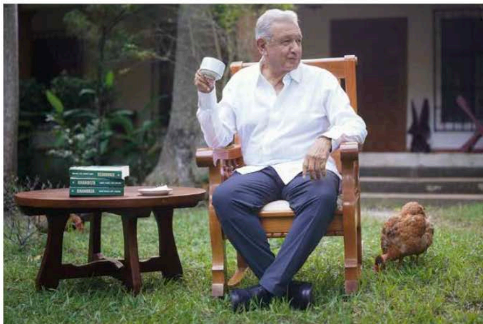
Desde Palenque. El exmandatario comentó que no hará gira por el país para promocionar el libro porque está jubilado.

"Ya me retiré de la actividad política y la presidenta es la que conduce y lo está haciendo muy bien"