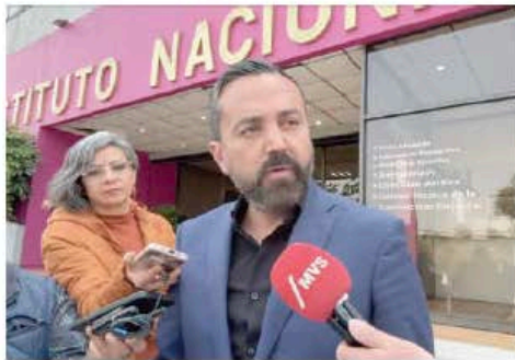
EL DIPUTADO federal morenista Arturo Ávila, ayer, en entrevista afuera del INE.