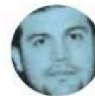
JOAQUÍN GUZMÁN LÓPEZ

› Para hacer frente a los comentarios malintencionados, la presidenta Claudia Sheinbaum reiteró que la salida de Alejandro Gertz Manero fue acordada. Cumplió su ciclo frente a la Fiscalía General de la República por lo que en su retiro no hubo resistencia. "Se cumplió un periodo e inicia otro", externó la mandataria.