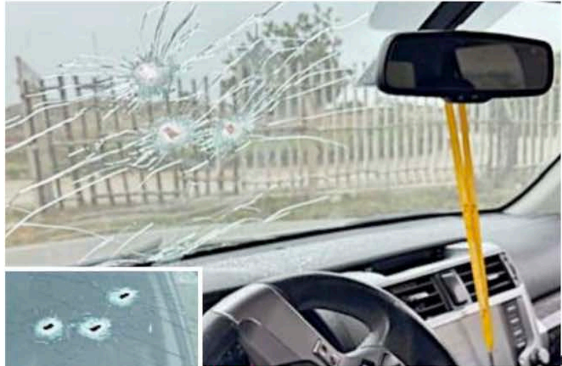
ALERTA. El vehículo del precandidato presidencial Rafael Belaúnde recibió impactos de bala en el sur de Lima.

La camioneta era "conducida por el político", confirmó el general Arriola con base en los resultados de las primeras investigaciones, que desmienten las versiones iniciales de que un chofer acom-