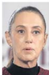
CARLOS MEJÍA EL UNIVERSAL

:::: Nos cuentan que una vez más, la presidenta Claudia Sheinbaum decidió arrancar un programa social, en este caso, de salud, en el Estado de