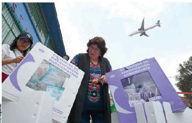
UNA MUJER mete a las urnas del IECM sus votos en las consultas de ayer.

EL ÓRGANO electoral registra más de 40 mil sufragios anticipados por sistema electrónico; personas dicen desconocer sobre el ejercicio; pendientes, trabajos del Participativo de 2025