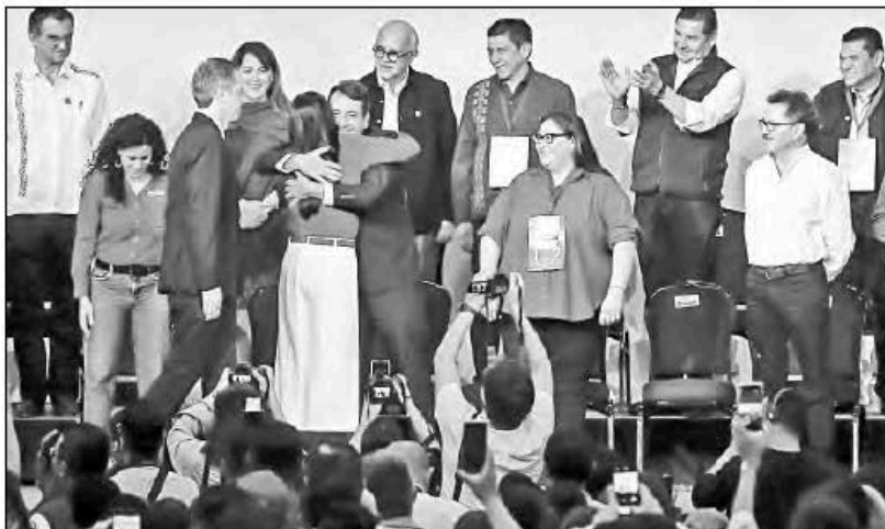
▲ En el Congreso Nacional de Morena celebrado ayer se concretó la llegada de

Y, EN TANTO ayer la presidenta Sheinbaum señalaba en el icónico San Salvador Atenco que “los que piensan que agachando la cabeza se sirve a la patria están muy equivocados; los mexicanos siempre tendremos la frente en alto como nos enseñaron los grandes luchadores sociales de nuestro país”, ¡hasta mañana!