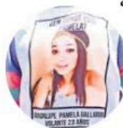
Colectivos se movilizarán

●● Nos dicen que colectivos de madres buscadoras van a participar en la 14 marcha de la Dignidad Nacional Madres Buscando a sus Hijos, Hijas, Verdad y Justicia con el lema “Las madres llegaremos al final”. En el caso de la Ciudad de México iniciará a las 10:00 horas en el Monumento a la Madre para llegar al Ángel de la Independencia. También nos comentan que el objetivo es aprovechar la narrativa del Mundial del Fútbol 2026 en México para visibilizar la desaparición de sus seres queridos y preparar la movilización para la inauguración de la copa del Mundo. Ya se verá, nos dicen, la manera en la que el gobierno de la capital del país, que encabeza Clara Brugada , reacciona ante estas movilizaciones.