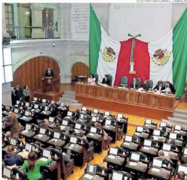
Bancadas Legislativas cuentan con las condiciones necesarias para dictaminar, aunque faltarían otras dos mesas de trabajo para afinar detalles

Avanzan convenios de regularización con el Issemym, luego de que algunos ayuntamientos descontaban cuotas sin enterarlas