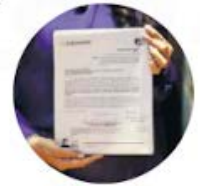
Iniciativa de reforma

●● Dentro de los legisladores de Morena hay muy pocas esperanzas de que la reforma electoral alcance los votos necesarios para ser aprobada. Sin embargo, el gobierno federal ha dicho que en caso de que la iniciativa no pase, hay un Plan B. Algunos especialistas consideran que “el diablo” de la reforma electoral vendrá en las leyes secundarias, muchas veces referidas en la iniciativa que se entregó ayer. Aseguran que, si no se logran los consensos para cambiar la Constitución, el Plan B será precisamente modificar la normativa secundaria.