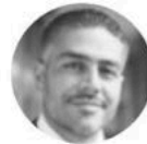
OMAR GARCÍA HARFUCH