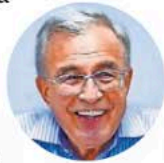
Rubén Rocha Moya

●● Después de que salió la acusación del Departamento de Justicia de Estados Unidos contra el gobernador con licencia de Sinaloa, Rubén Rocha , y otras nueve personas por vínculos con el narcotráfico, la Fiscalía General de la República (FGR) dijo que esperará pruebas para definir si solicita órdenes de aprehensión en contra de los señalados por las autoridades estadounidenses. Por otro lado, en el caso Chihuahua, Ulises Lara , vocero de asuntos relevantes de la FGR, dijo que citaron a declarar a cerca de 50 funcionarios de Chihuahua para aclarar sobre la participación de los agentes de la CIA en la destrucción del narcolaboratorio en la Sierra del Pinal en Chihuahua. ¿Será que ambas investigaciones llevan la misma velocidad? ¿Para cuándo habrá citados a declarar en el caso Sinaloa?