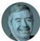
JUAN RAMÓN DE LA FUENTE

» La Jefa de Gobierno de la CDMX, Clara Brugada , hizo un llamado de respeto a México y reconoció el desempeño y la labor del gabinete de Seguridad federal, de Omar García Harfuch . Esto, después de la intervención militar de EU en Venezuela. La mandataria capitalina destacó la reducción de 35 por ciento en los homicidios dolosos a nivel nacional.