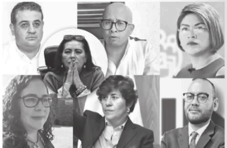
La consejera presidenta apuntaría a rodearse de manos derechas

La participación de estos perfiles respondería a la necesidad de consolidar una mayoría dentro del Consejo General del INE