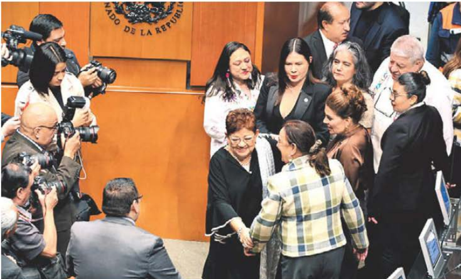
La designación de Godoy, muestra de un Congreso dominado. ARIANA PÉREZ