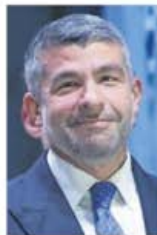
CARLOS MEJÍA EL UNIVERSAL

:::: Tal parece que el enfrentamiento entre los diputados locales de Morena y el alcalde de Miguel Hidalgo, Mauricio Tabe , no termina. El edil panista dio a conocer que recibió una petición de