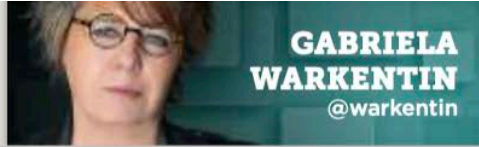
GABRIELA WARKENTIN @warkentin

¿Qué está pasando? ¿Trump solo quiere el petróleo? ¿Las resistencias serán suficientes para revertir la barbarie? Tenemos la obligación de hacernos preguntas.