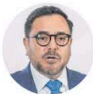
Arturo Reyes Sandoval

●● En el Instituto Politécnico Nacional corre una pregunta con filo diplomático. Ante el pleito entre la dirección general del Poli y la Fundación Politécnico A. C., que dejó varados y sin recursos a decenas de estudiantes becados en Reino Unido, ¿no habrá espacio en la residencia oficial de México en Londres para alojarlos? Dicen que ahora que se supo que, en esa residencia, destinada para los embajadores y su familia, se recibe a estudiantes para que vivan por algunos meses gratis y con todos los servicios incluidos, quizá podría haber un huequito para los politécnicos desamparados que llevan semanas sobreviviendo entre deudas, rentas atrasadas y comidas recortadas. Quizá puedan estar en esa mansión algunos meses, mientras que el director del IPN, Arturo Reyes Sandoval , aclara, si es que puede, las irregularidades en el manejo de los dineros que deberían haber llegado a Inglaterra.