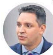
Aristides Guerrero García

●●Nos dicen que el ministro Aristides Guerrero García va a presentar este jueves ante el pleno de la Suprema Corte de Justicia de la Nación (SCJN) un proyecto con la finalidad de validar que el Instituto Mexicano de la Propiedad Industrial (IMPI) pueda ordenar el bloqueo de contenidos en sitios de Internet. Nos comentan que el caso llegó a la SCJN, debido a una solicitud de un Tribunal Colegiado que se declaró incompetente para resolver el tema de constitucionalidad.