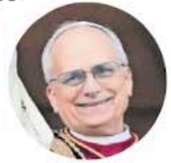
Papa León XIV