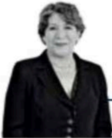
DELFINA GÓMEZ ÁLVAREZ