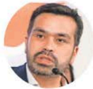
Jorge Álvarez Máynez

●●No sólo el senador de Morena Gerardo Fernández Noroña tiene gusto por los viajes trasatlánticos en clase Premier. Ayer, imágenes mostraron al líder nacional de Movimiento Ciudadano, Jorge Álvarez Máynez , en una sala de la terminal 3 del aeropuerto internacional de Heathrow, en Londres, y más tarde ocupando un asiento en Clase Noroña. Nos hacen notar que el líder naranja decidió visitar Inglaterra, justo cuando la capital londinense vivía euforia del partido de semifinal de la Champions League, entre Arsenal contra Atlético de Madrid, resultado e imágenes que el señor Álvarez Máynez repostó en redes sociales. La única diferencia con Noroña y otros morenistas que viajan a todo lujo a Europa, es que don Jorge no presume de haber hecho votos de austeridad republicana o pobreza franciscana.