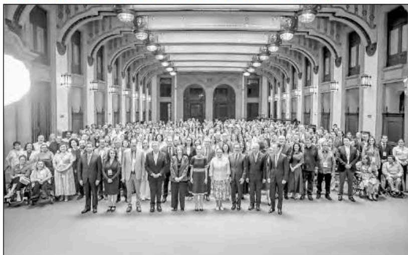
▲ Legisladores federales de Morena, PT y PVEM se reunieron con la jefa del Ejecutivo