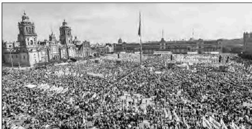
▲ Vista de la Plaza de la Constitución durante el acto realizado el sábado para conmemorar