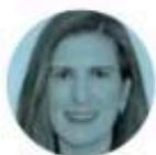
KENIA LÓPEZ RABADÁN

» Causó ruido entre sectores de la política nacional el "regreso" del ex-presidente Enrique Peña Nieto a tierras aztecas... aunque no fue para quedarse, sino una visita a su madre en Ixtapan de la Sal, según versiones periodísticas. Vino de piso y corre, ya que tiene una investigación por presuntamente otorgar contratos a empresarios del caso Pegasus.