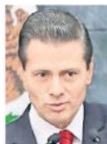
Enrique Peña Nieto