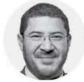
MARTÍ BATRES G. @martibatres