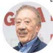
Héctor Díaz Polanco

●● Luego de que Morena realizó su Consejo Nacional varias dudas quedaron despejadas para los que ya andaban comiendo ansias para pelear por las candidaturas locales. Para el caso de la Ciudad de México, nos precisan, el Comité Estatal será el que emita las convocatorias para todos aquellos aspirantes que se someterán a una encuesta y el ganador será seleccionado el próximo 21 de septiembre, mientras que para los que aspiran a los cargos de distritos electorales, es decir, diputados locales, la fecha de definición será el 8 de noviembre.