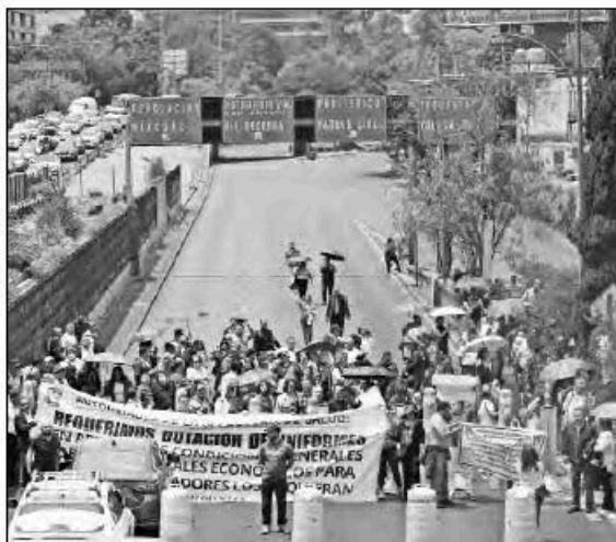
▲ Integrantes de 12 secciones del Sindicato Nacional de Trabajadores de la Secretaría de Salud bloquearon ayer Viaducto Río de la Piedad en demanda de mejoras laborales.

PACTARON UNA TREGUA Trump y el gobierno de Irán para detener las hostilidades y, al mismo tiempo, abrir el paso de Ormuz. Líbano no estaba en el acuerdo, fue la coartada, e Israel lanzó, o continuó, una ofensiva furiosa.