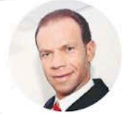
Luis Roberto Alves “Zague”

●● Ayer, el personal de resguardo de la Cámara de Diputados ejecutó un operativo “impresionanti” para cuidar al exfutbolista brasileño-mexicano Luis Roberto Alves , mejor conocido como “Zague”. El delantero mexicano llegó al recinto legislativo de San Lázaro para jugar un partido amistoso con los diputados, sin embargo, decenas de trabajadores y presentes se abalanzaron para pedirle fotos y autógrafos, motivo por el que el personal de resguardo tuvo que protegerlo. Incluso cuando llegó a la cancha la gente se metió al campo, y los miembros del resguardo tuvieron que cerrar la reja para que dejaran jugar al delantero.