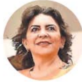
Ivonne Ortega Pacheco

●● Nos hacen notar que, al parecer, Morena está encontrando a un nuevo aliado, que ayer le ayudó a aprobar el Plan B en el pleno de la Cámara de Diputados. Se trata de Movimiento Ciudadano, que coordina la diputada Ivonne Ortega . Si bien los diputados emecistas no definieron la aprobación de esta reforma constitucional en materia electoral, sus votos sí hicieron que se avalara con holgura, tanto en comisiones unidas, como en el pleno. Y, lo que más llama la atención es que en el Senado, toda la bancada de MC votó en contra de esta misma reforma, que hoy avalaron algunos de sus diputados. ¿Será que, ante los remilgos del PT, Morena está intentando construir una nueva alianza? ¿Se verá de nuevo a Fosforena?