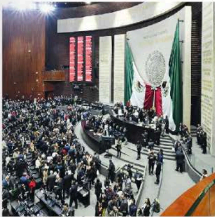
· Genera división de opiniones

pulación o desinformación. Además, incluye medidas para reforzar la paridad de género en candidaturas, ampliar las consultas populares y mecanismos de democracia directa, así como fortalecer sistemas de conteo y transparencia de resultados, manteniendo el PREP.