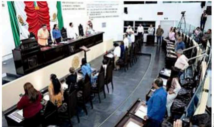
El Congreso de Tabasco presumió en redes ser el primer Legislativo estatal en avalar los cambios constitucionales en materia electoral.

Los diputados del PT y el Partido Verde quedaron conformes sin la revocación de mandato ni el recorte al financiamiento a partidos y apoyaron la propuesta presidencial, que, aseguraron, responde al principio de la austeridad.