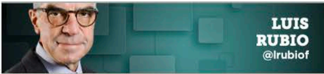
LUIS RUBIO @lrubiof

Es absurdo esconder la realidad violenta y carente de legalidad por proteger a un partido que resultó ser el más corrupto y abusivo.