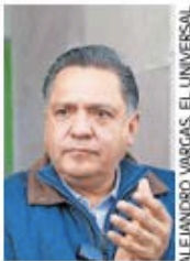
ALEJANDRO VARGAS, EL UNIVERSAL

::::: La vigilancia al transporte y distribución de gas LP en Toluca confirma que la seguridad pública también se construye desde la prevención y el cumplimiento de normas. La estrategia impulsada por el gobierno municipal, bajo la instrucción de Ricardo Moreno , envía el mensaje de que no hay margen para la improvisación en un servicio que implica riesgos mayores; sin embargo, el alcance real de estas acciones dependerá de su continuidad y de la firmeza para sancionar omisiones. Más allá de las inspecciones puntuales, el reto es convertir la supervisión en una práctica constante y verificable, capaz de garantizar que la seguridad de la población.