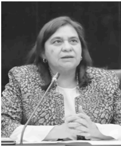
Violencia digital afecta cada vez más a mujeres en política

Finalmente, subrayaron que la democracia sólo podrá consolidarse cuando las mujeres puedan ejercer plenamente sus derechos políticos sin miedo, tanto en el espacio público como en el entorno digital, mientras ello no ocurra, afirmaron, el 8 de marzo seguirá siendo una fecha de exigencia y no de celebración.