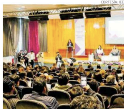
Experta señala que el ciberacoso y las amenazas en línea perpetúan desigualdades