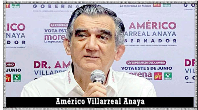
Américo Villarreal Anaya