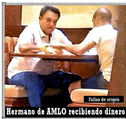
Fallas de origen Hermano de AMLO recibiendo dinero

quien además figura como viajero frecuente en la aeronave del empresario asesinado.