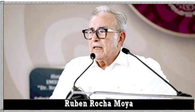
Ruben Rocha Moya