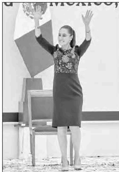
▲ Hace unos días la presidenta Claudia Sheinbaum fue destacada por su estilo y ayer fue reconocida como una de las cinco mujeres más poderosas del mundo.