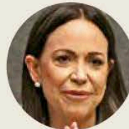
● María Corina Machado Parisca

Lo ocurrido en las últimas horas con las dos figuras cumbre de América Latina es una paradoja formidable. La mujer de izquierda, mexicana, era reconocida por el New York Times como una de las personas más elegantes y mejor vestidas del mundo, mientras la liberal clásica, venezolana, huía en una lancha (según The Wall Street Journal ) de la dictadura de su país para tratar de llegar a Noruega y recibir el Premio Nobel de la Paz. Ya la historia ponderará cuánto de virtud o tragedia hubo en esto. Me limito a subrayar que América Latina nunca tuvo en un mismo tiempo a dos figuras mundiales. Dos mujeres que no pudieron acompañarse, escudarse. La diferencia sustantiva es que una detentaba un poder inmenso y otra se debía esconder porque la despedazarían en los calabozos del madurismo. La mexicana ha sido esquiva y fría con la venezolana. “Hay momentos en la vida en que no hay espacio para la indiferencia”, me dijo en mayo María Corina , cuando seguramente no imaginaba el Nobel. “No entiendo el silencio de la presidenta Sheinbaum , porque, al final, ese silencio termina avalando a quienes cometen crímenes. La historia será implacable con las que hicieron lo correcto, las que hicieron lo incorrecto y las que no hicieron nada”. Palabras que quizá habría repetido ayer. En Oslo, o en la lancha.