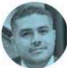
OMAR GARCÍA HARFUCH