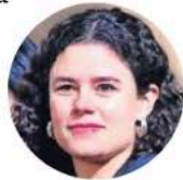
Luisa María Alcalde