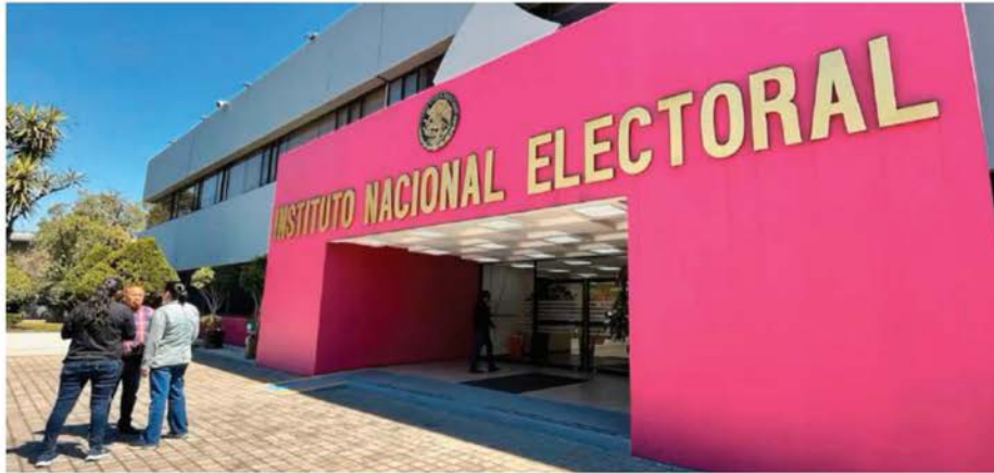
El INE asegura que el acompañamiento es para garantizar la inclusión de voces diversas

El próximo lunes, organizaciones civiles, asociaciones especializadas y actores del ámbito electoral entregarán formalmente sus propuestas de Reforma Electoral a la Comisión Presidencial encargada del tema, encabezada por Pablo Gómez. La presentación contará con el acompañamiento de la consejera presidenta del Instituto Nacional Electoral (INE), Guadalupe Taddei Zavala. De acuerdo con el INE, la par-