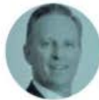
JOSÉ MEDINA MORA