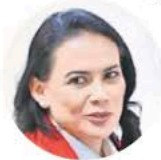
Alejandra del Moral

●● Ayer estuvo en Palacio Nacional la excandidata del PRI a la gubernatura del Estado de México, Alejandra del Moral , quien ahora encabeza la Agencia Mexicana de Cooperación Internacional para el Desarrollo (Amexcid). La presencia de la señora Del Moral, nos hacen notar, se da luego de que la Amexcid, dependiente de la Secretaría de Relaciones Exteriores, decidió reservar por cinco años, a petición de Cuba, la información sobre la ayuda humanitaria enviada de México a la isla. Será que le habrán dado un jalón de orejas a la funcionaria por haber decidido atender la petición cubana de no revelar la información sobre la ayuda enviada, o quizá el eventual regaño sería por haber dicho la verdad sobre la solicitud de La Habana de guardar silencio.