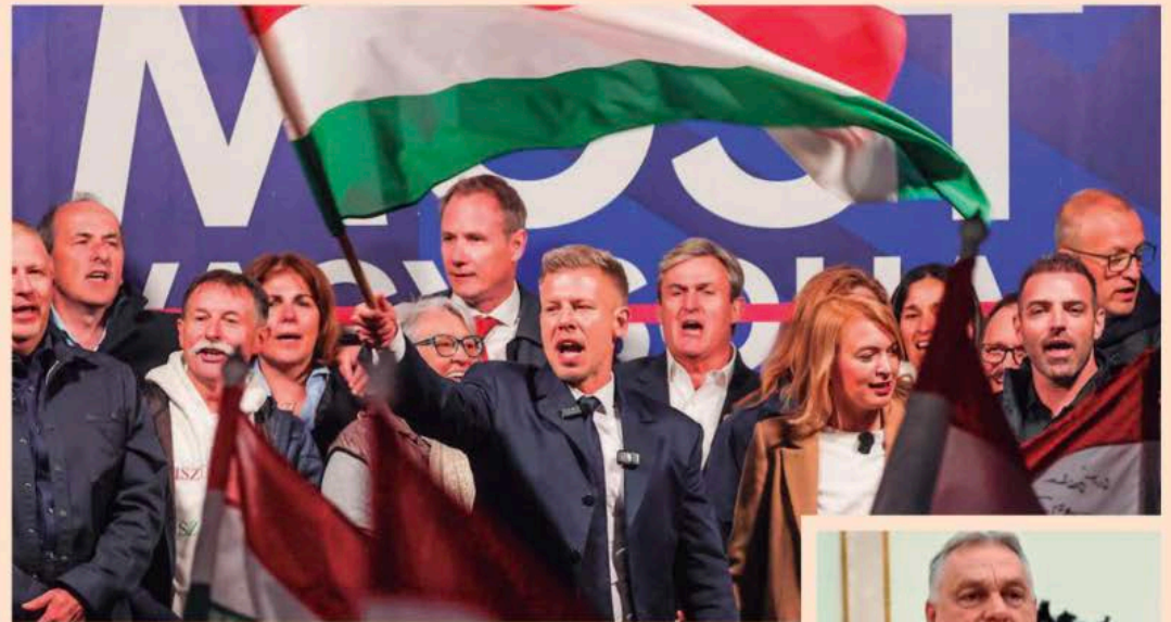
El conservador Péter Magyar (arriba) protagonizó una de las mayores sacudidas políticas en Hungría en décadas al derrotar al primer ministro Viktor Orbán, con 16 años en el poder.