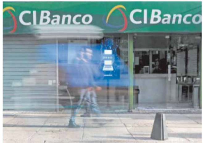
Los bienes y derechos que todavía son de la institución fueron tomados por el IPAB.

Tras toda esta medida se busca asegurar que el proceso de liquidación sea transparente y que se identifiquen todas las responsabilidades legales derivadas del manejo de la institución.