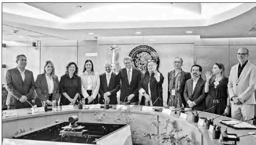
▲ La presidenta del Instituto Nacional Electoral (INE), Guadalupe Taddei, y consejeros del organismo se reunieron con integrantes de la Junta de Coordinación