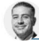
OMAR GARCÍA HARFUCH

La gobernadora interina de Sinaloa, Yeraldine Bonilla , se estrenó en las reuniones del IMSS-Bienestar con la presidenta Sheinbaum. Ayer fue a Palacio Nacional al encuentro en el que se dio seguimiento a ese sistema de salud. Estaba tan emocionada de asistir que posteó en sus redes sociales una foto de su llegada al recinto presidencial.