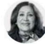
ROSI WONG ROMERO

A fin de fortalecer la transformación educativa en el Edomex, el secretario del ramo, Miguel Ángel Hernández , se reunió con rectores de universidades y tecnológicos para consolidar estrategias de vinculación institucional que permita reforzar programas y proyectos orientados a brindar a la juventud una formación de excelencia.