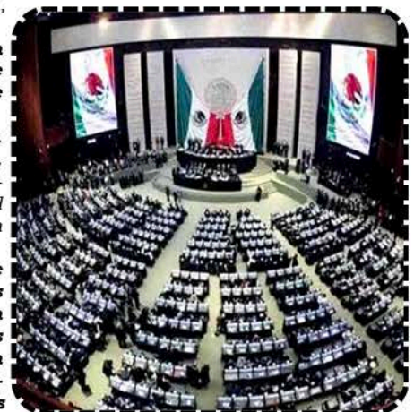
Congreso de la Unión. Sede del Poder Legislativo