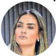
Alessandra Rojo de la Vega

●● A través de redes sociales se difundió un video en el que se observa a un hombre entregar un volante en el que se ve la imagen de la alcaldesa de Cuauhtémoc, Alessandra Rojo de la Vega , y se le señala de negligente, debido al colapso del edificio en San Antonio Abad; el sujeto, según se ve en las imágenes, porta un chaleco de color guinda como los que usan los brigadistas del Gobierno de la Ciudad de México. La imagen fue retomada por la edil, quien pidió a los vecinos grabar y exhibir a quienes reparten estos volantes. En este espacio le comentamos que el pleito entre el Gobierno central y la alcaldía en torno al colapso del inmueble que dejó tres personas fallecidas apenas comenzó.