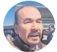
Pedro Rodríguez Villegas

●● El presidente de Atizapán de Zaragoza, Pedro Rodríguez Villegas , reconoce que el municipio que gobierna mantiene una incidencia delictiva menor en comparación con los municipios aledaños, de acuerdo con las cifras del Secretariado Ejecutivo del Sistema Nacional de Seguridad. Ante este panorama, nos comentan que el alcalde está planeando la implementación de un nuevo esquema de seguridad que contemple la coordinación con los municipios vecinos que, por cierto, son gobernados por morenistas, con el objetivo de fortalecer las estrategias regionales y atender de manera conjunta los retos en materia de seguridad pública.