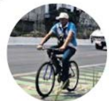
Ciclocarriles de la CDMX

●● Nos cuentan que a poco menos de un mes de que empiece el Mundial de Fútbol, organizaciones civiles convocaron a una “ciclopinta” para pintar los ciclocarriles de la Ciudad de México, a manera de exigencia de que la capital tenga cruces seguros y accesibles e infraestructura “de clase mundial”. Nos comentan que la cita será hoy a las nueve de la mañana a la altura de Santiago y Pedro de Alba. También se pintará el ciclocarril del bajo-puente de Niños Héroes-Fernández del Castillo.