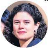
Luisa María Alcalde

●● Con el estallido de casos judiciales y la cascada de informaciones provenientes de Estados Unidos sobre los planes del gobierno de Donald Trump contra la narcopolítica en México, nos cuentan que el equipo de comunicación de Presidencia se vio abrumado hasta el punto de que la presidenta Claudia Sheinbaum propuso hacer un "programa especial" para tratar de desmentir a los medios de comunicación.