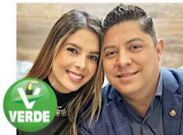
■ La Senadora Ruth González y el Gobernador de SLP, Ricardo Gallardo.

La Presidenta fue cuestionada sobre la reforma electoral aprobada el fin de semana en San Luis Potosí, llamada "Ley Ruth" en referencia a Ruth González, esposa del Gobernador Ricardo Gallardo (PVEM), quien busca participar en la contienda a la Gubernatura en el 2027.