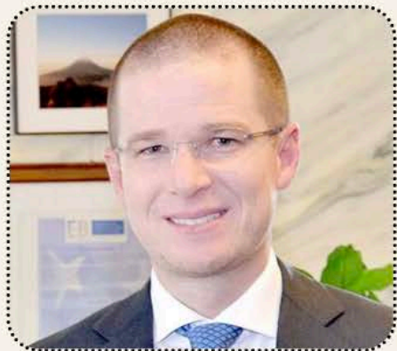
Ricardo Anaya Cortés