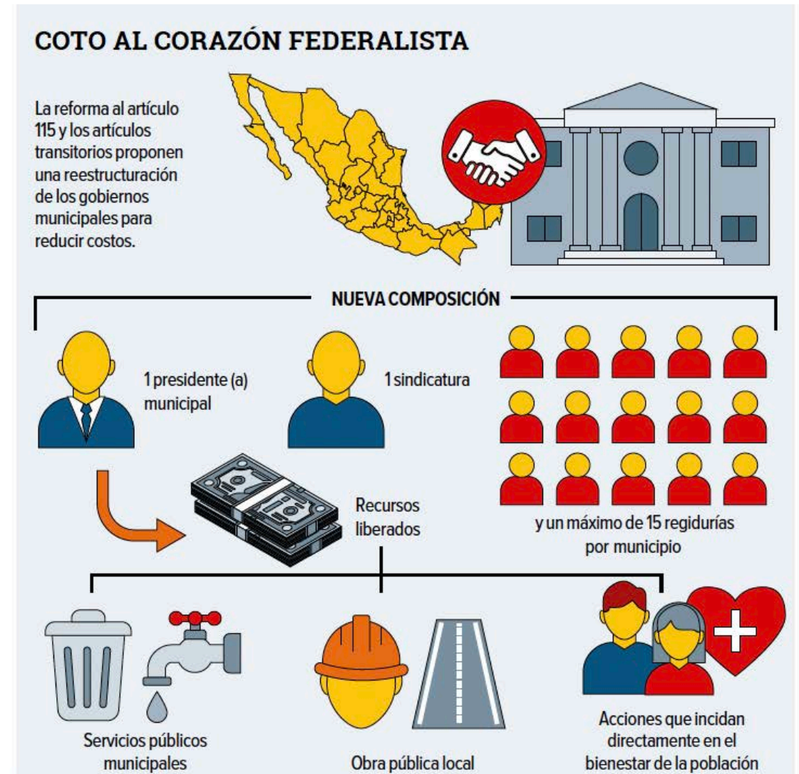
Gráfico: Abraham Cruz

La reforma presidencial dispone en el régimen transitorio que “las legislaturas de las entidades federativas preverán los ajustes necesarios a sus presupuestos con el objeto de que las reducciones que, en su caso, se realicen en cumplimiento a lo previsto en el artículo