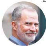
Rey Felipe VI

●● Los mensajes han sido de ida y vuelta. El rey Felipe VI admitió que durante la conquista hubo “mucho abuso” y en reacción, la presidenta Claudia Sheinbaum reconoció el gesto del monarca.