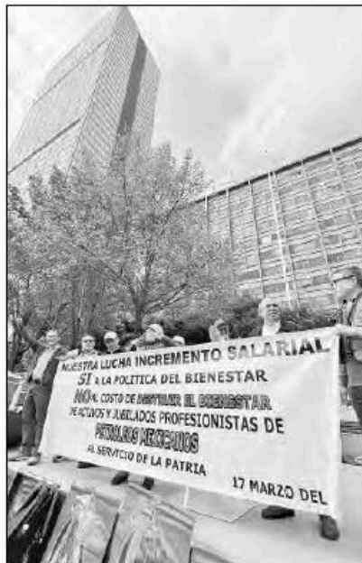
▲ La Unión Nacional de Técnicos y Profesionistas Petroleros protestó ayer frente a la torre de Pemex para exigir respeto al incremento salarial de 4.5 por ciento a trabajadores activos y jubilados, acordado con el sindicato mayoritario. Anunció que impugnará la reforma que acaba con las pensiones millonarias.