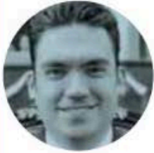
JORGE ROMERO HERRERA PRESIDENTE DE ACCIÓN NACIONAL