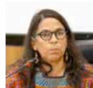
MAYARÍ FORNO OLIVA COMUNIDAD INDÍGENA / MIGRANTE