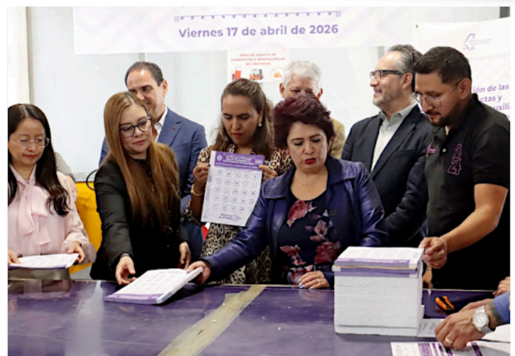
■ Durante el arranque, consejeros del IECM celebraron el 15 aniversario del Participativo.