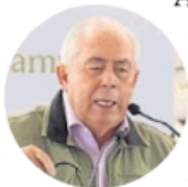
Leonel Cota Montaña

●●Quien estuvo de visita por el Senado esta semana fue el exgobernador de Baja California Sur, exdirector de Segalmex y actual subsecretario de