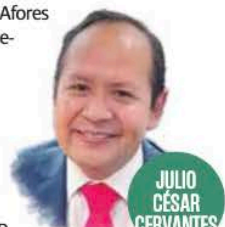
JULIO CÉSAR CERVANTES

LOS RETIROS POR desempleo en las Afores ya suman tres mil 986 millones de pesos sólo en abril y 14 mil 474 millones en el primer cuatrimestre, de acuerdo con la Consar, que preside Julio César Cervantes, y el dato obliga a mirar más allá del sistema de ahorro. El incremento, superior a 30% anual, difícilmente puede explicarse únicamente por la expansión del SAR, como sostiene la industria. La disposición anticipada de recursos refleja tensiones en el mercado laboral que terminan resolviéndose con ahorro pensionario. Afore Coppel y Azteca concentran los mayores montos, lo que también perfila a los segmentos más expuestos. Ya en 2025 se registró un máximo histórico de 38 mil 882 millones de pesos retirados por este concepto. ■