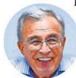
Rubén Rocha Moya