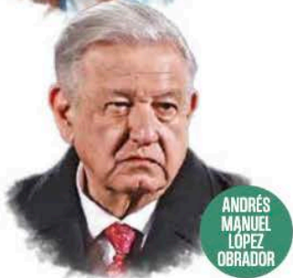
ANDRÉS MANUEL LOPEZ OBRADOR

A REFORMA JUDICIAL de Andrés Manuel López Obrador nació entre críticas, desconfianza y una polarización inédita.