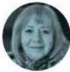
ROSARIO PIEDRA IBARRA

» Se prepara una actividad como respuesta a la marcha de la Generación Z del sábado pasado, pues la militancia de la Cuarta Transformación ha convocado a una manifestación para salir a las calles el 6 de diciembre para respaldar la administración de la presidenta de México, Claudia Sheinbaum Pardo . Frente al escenario de lo que ocurrió el pasado 15 de noviembre, y la protesta convocada para el 20 de este mismo mes, la 4T se plantea pasar al activismo.