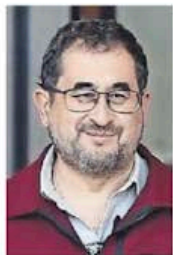
BERENICE FREGOSO. EL UNIVERSAL

:::: Por cierto que ayer, durante la conferencia de prensa en la que el Gobierno capitalino dio cuenta de las detenciones realizadas en la marcha del pasado sábado convocada por la Generación Z , el