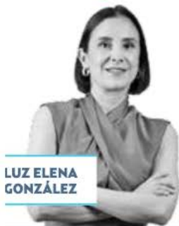
LUZ ELENA GONZÁLEZ

► Con las nuevas inversiones en generación de energía eléctrica, presentadas ayer en Palacio Nacional por las titulares de la Secretaría de Energía, Luz Elena González ; y de la Comisión Federal de Electricidad, Esther Calleja , se refrenda el trabajo conjunto en el sector que representan. Ambas han procurado avanzar de manera ordenada en los proyectos estratégicos que el país requiere, para consolidar la justicia energética. Siempre, bajo el liderazgo de la presidenta Sheinbaum.