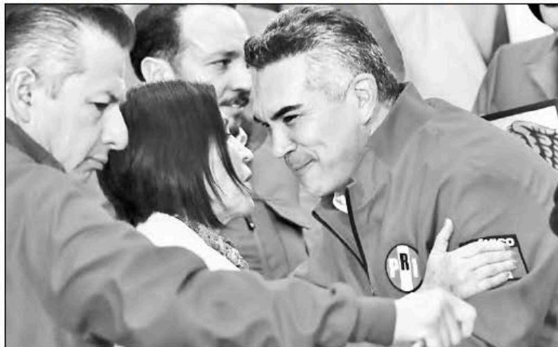
▲ El dirigente nacional del PRI, Alejandro Moreno Cárdenas, anunció la creación de una red ciudadana de “defensores de México”